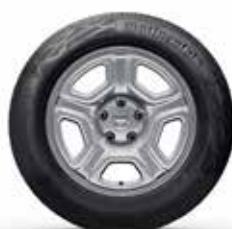
16" TĒRAUDA DISKI FIDJI