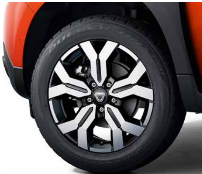
17" VIEGLMETĀLA DISKI

*Izņemot priekšējo lukturu tālās gaismas