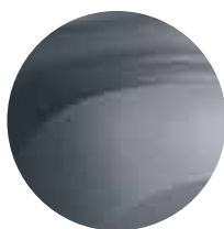
PELĒKĀ SLATE (2)