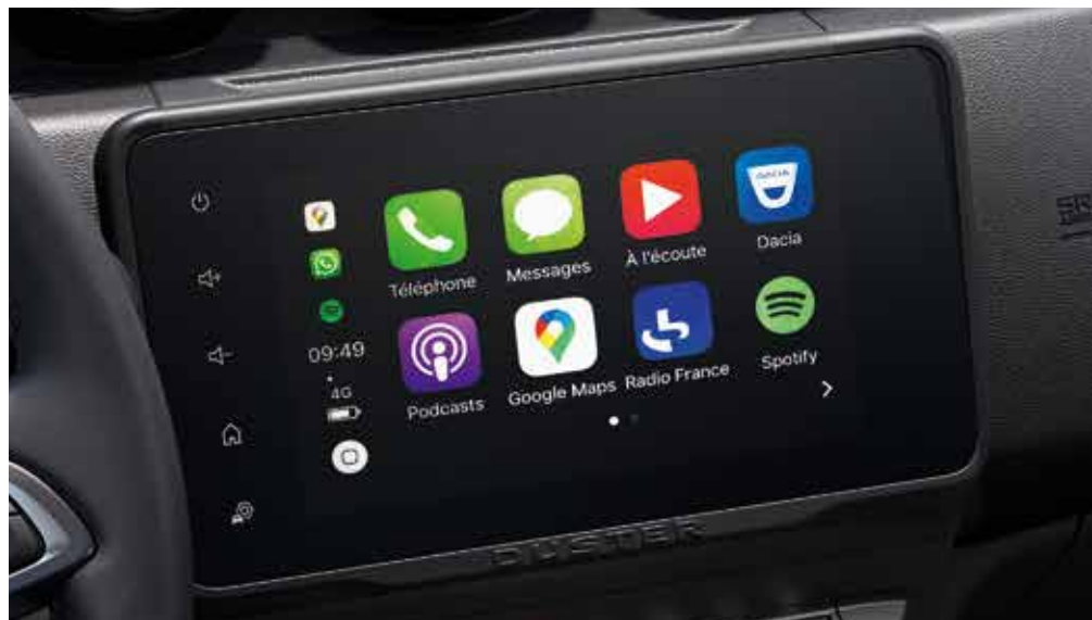
VIEDTĀLRUŅA REPLICĒŠANA AR APPLE CARPLAY™ VAI ANDROID AUTO™ 8 COLLU SKĀRIENEKRĀNĀ