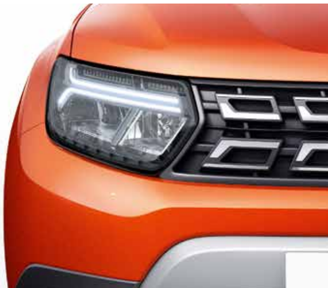
JAUNS PRIEKŠDAĻAS DIZAINS