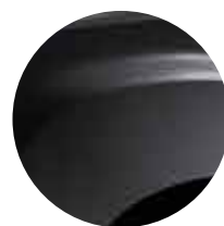
MELNĀ PEARL (2)