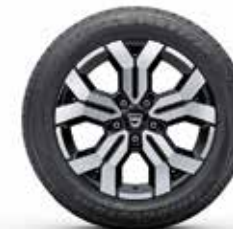
17" VIEGLEMTĀLA DISKI TERGAN