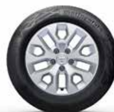
16" VIEGLMETĀLA DISKI ORAGA