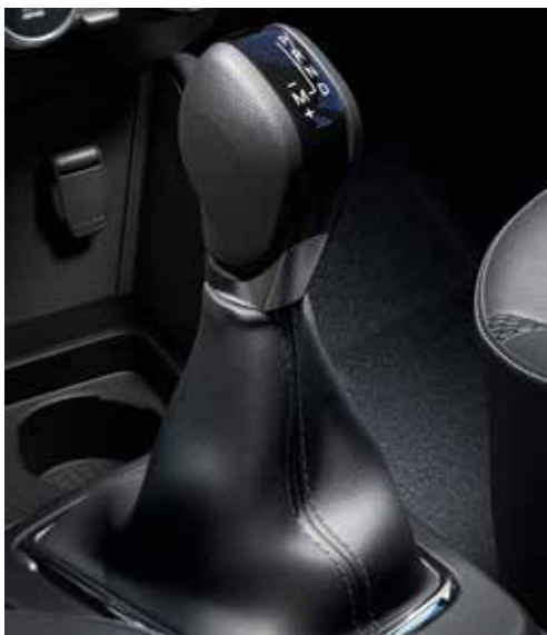
AUTOMĀTISKĀ EDC PĀRNESUMKĀRBA

Android Auto™ ir Google Inc. preču zīme. Apple CarPlay™ ir Apple Inc. preču zīme.