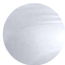
BALTĀ GLACIER (1)