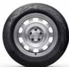
16" TĒRAUDA DISKI