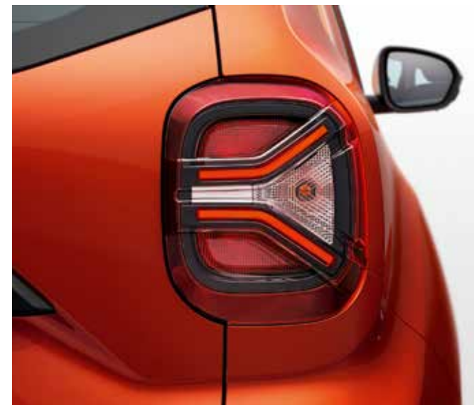
LUKTURI AR Y FORMAS LED GAIMĀM